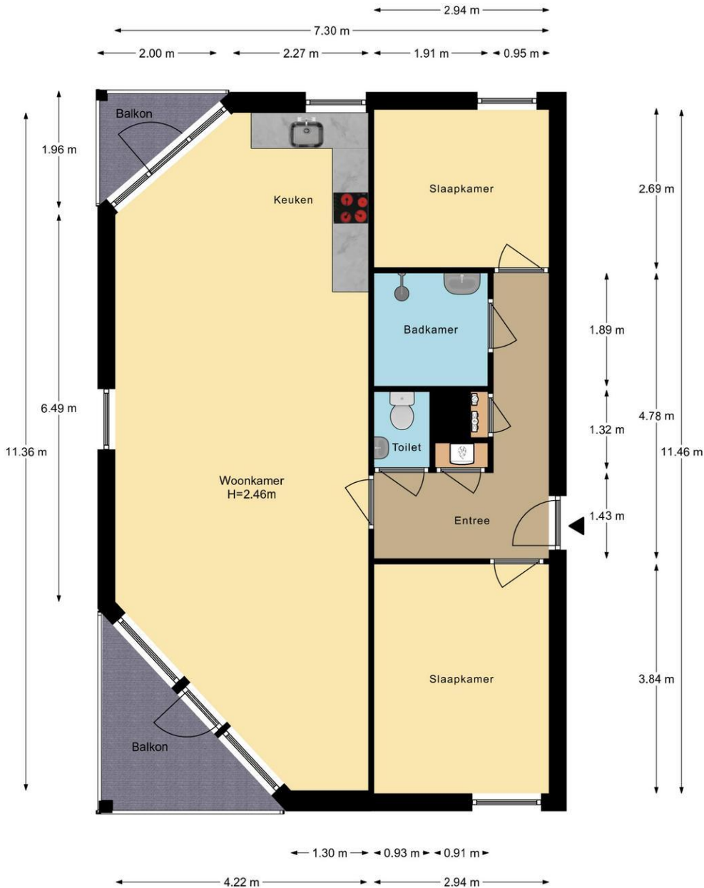
Dennenlaan 1E Zwanenburg Appartement